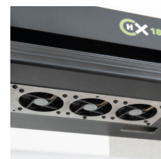
ALIMENTACIÓN papel automático: más potente y preciso, gracias al nuevo sistema ventiladores integrados

CXH incluye la calidad icónica de ALGOTEX con excelencia de vanguardia.