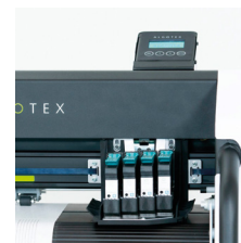
MONITOR integrado, máximo ergonomía