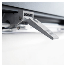
ROLLO DE PULSADOR nuevo sistema, sin necesidad de frenos

CXH es el trazador HP más rápido en el mercado: confiable, de alto rendimiento e innovador.