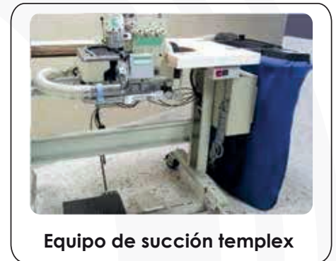
Equipo de succión templex